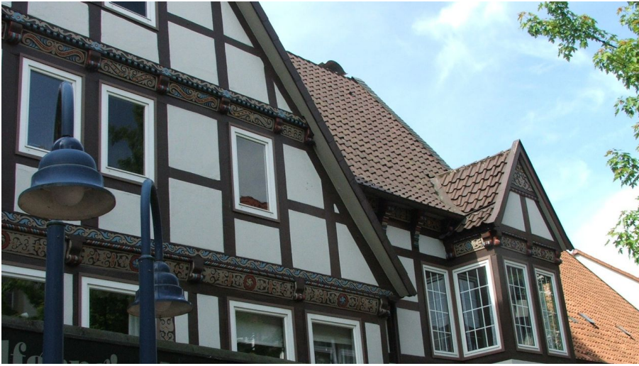
Giebel Ackerbürgerhaus Lange Str. 64