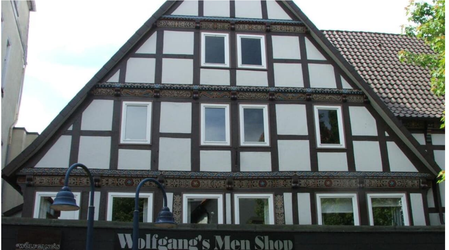
Ackerbürgerhaus Lange Str. 64