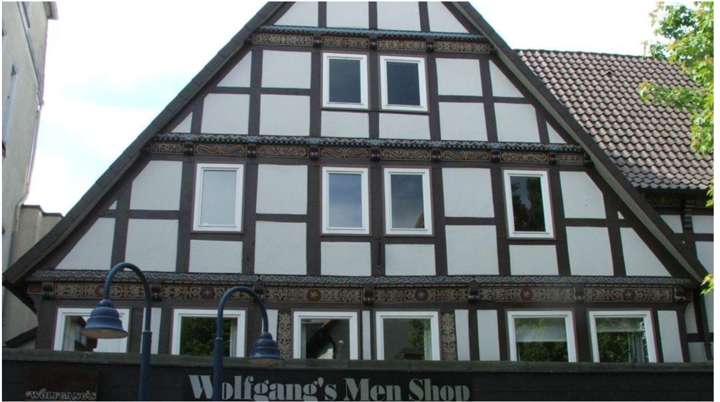
Ackerbürgerhaus Lange Str. 64