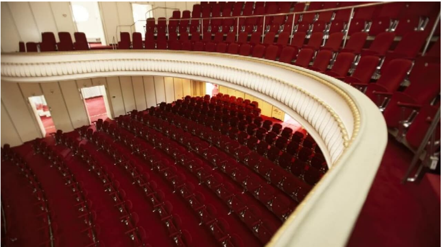
Das Theater im Park