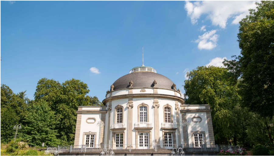
Theater im Park, Bad Oeynhausen