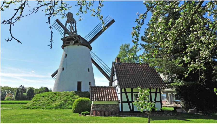
Wegholmer Mühle