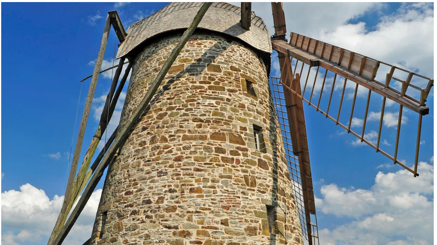
Großenheider Königsmühle