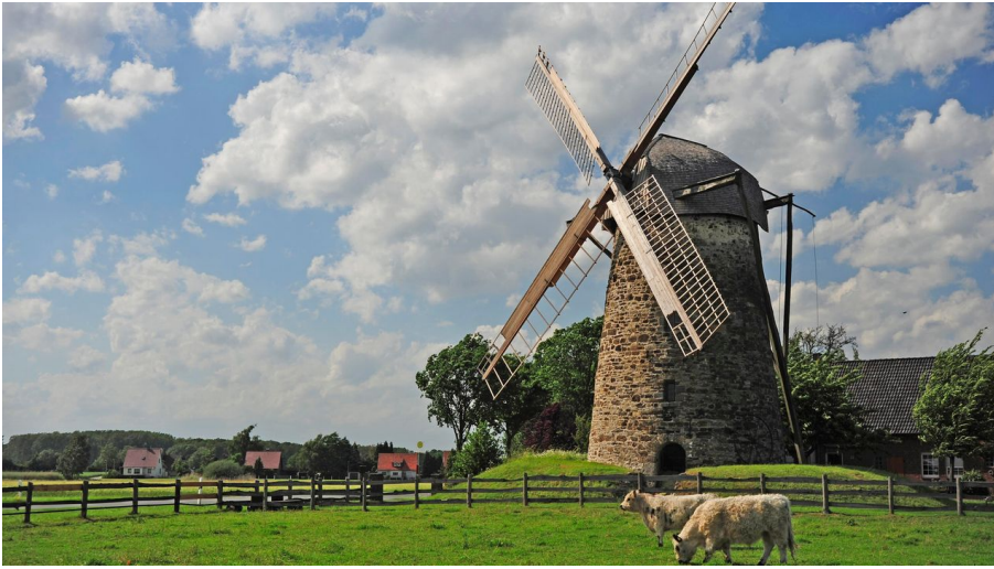
Großenheider Königsmühle