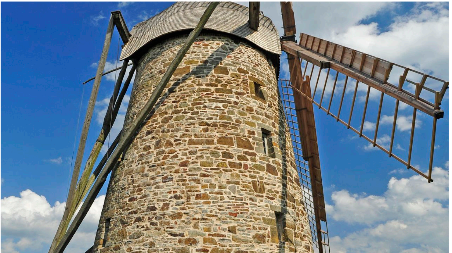
Großenheider Königsmühle