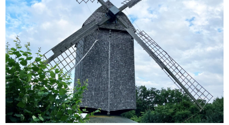
Bockwindmühle Wehe2.jpeg