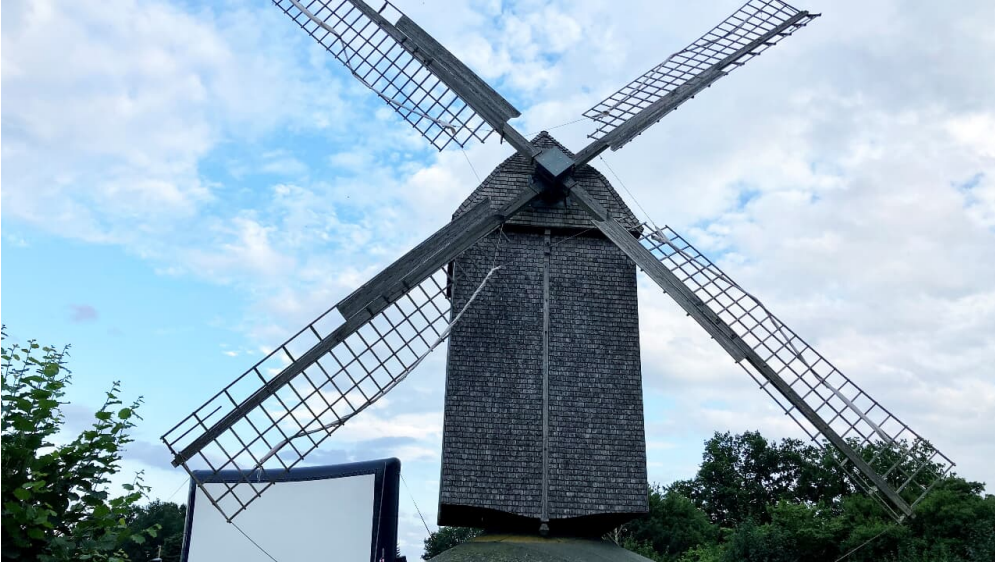
Bockwindmühle Wehe