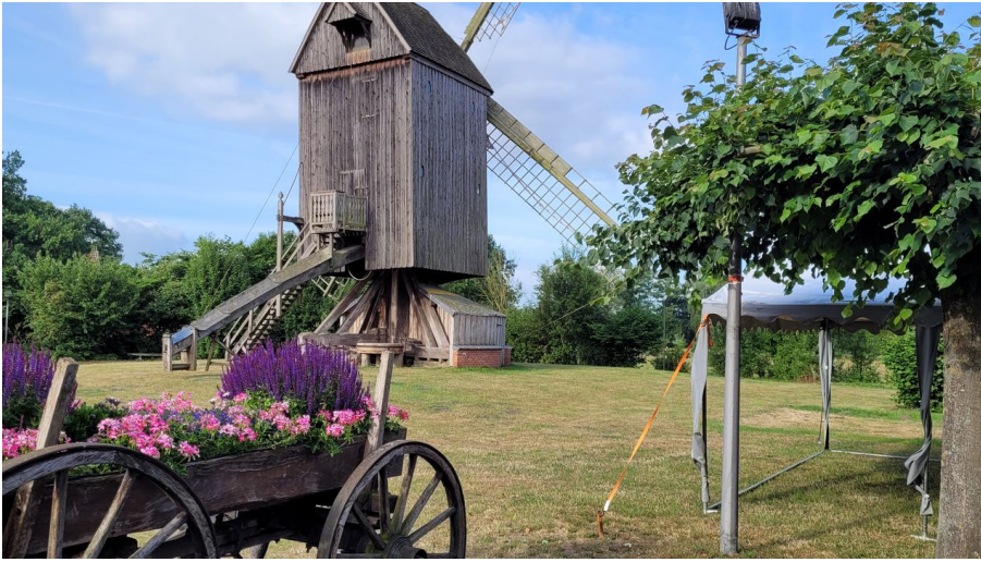
Bockwindmühle Wehe