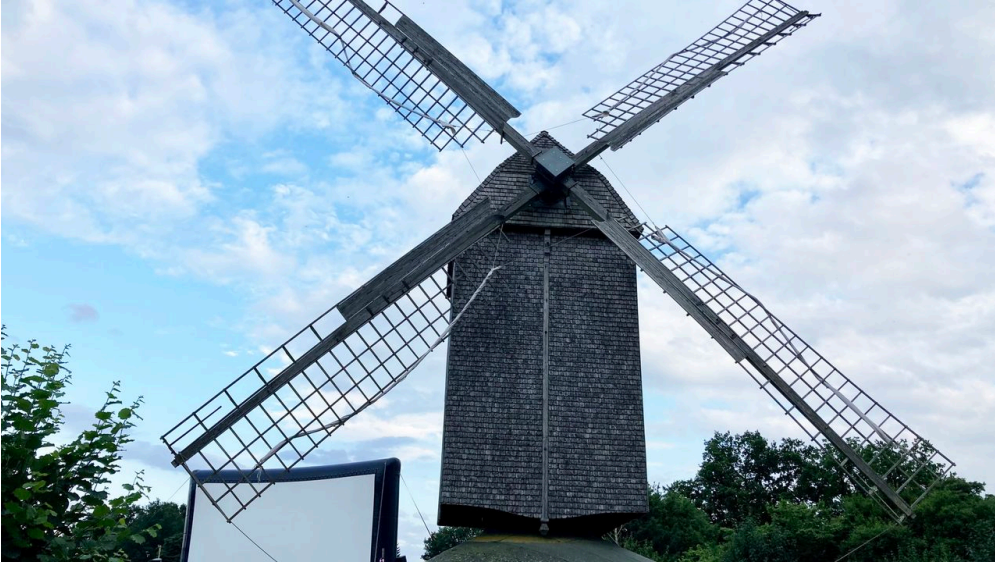
Bockwindmühle Wehe