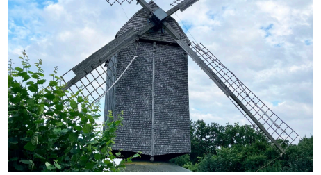
Bockwindmühle Wehe