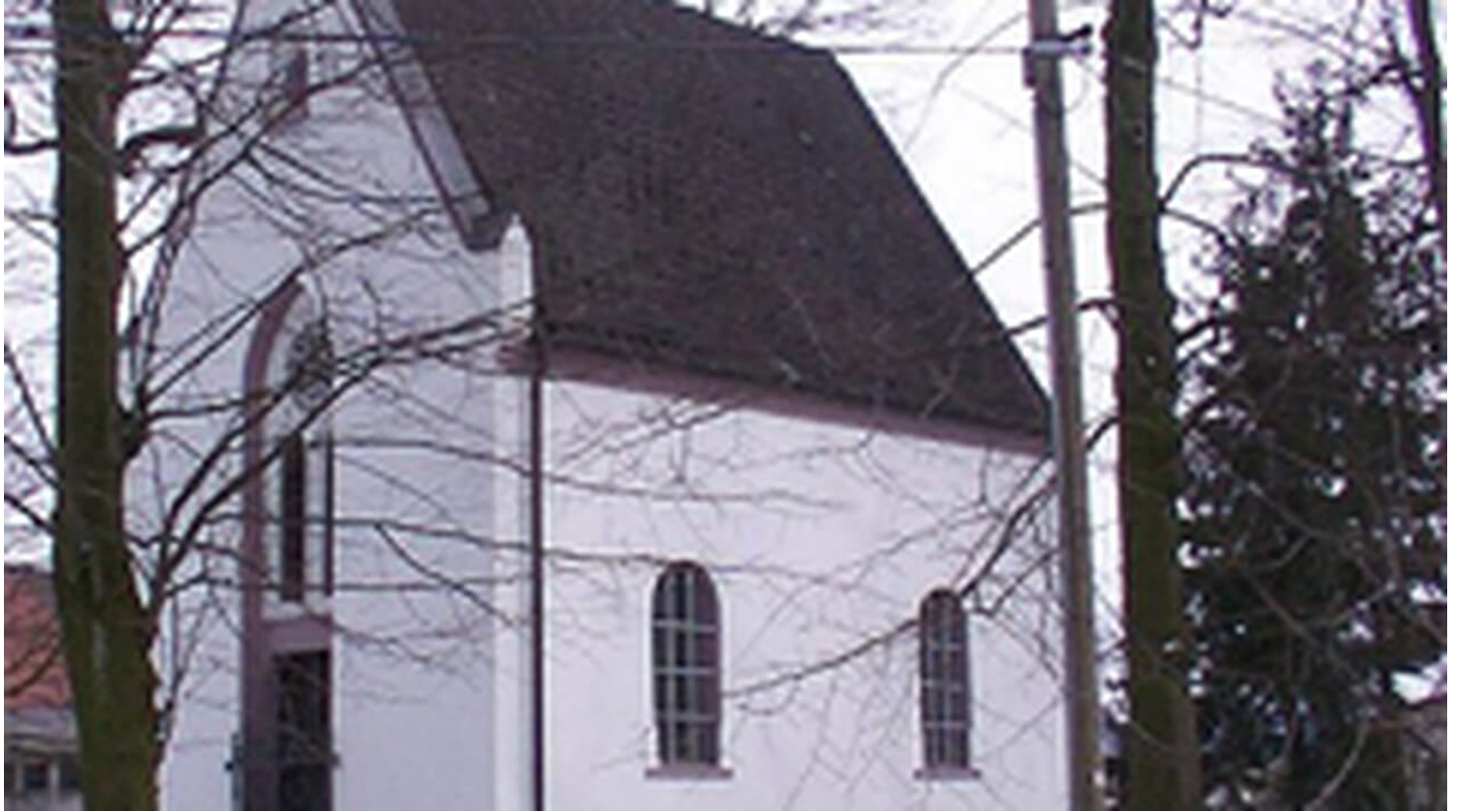
Lindenkapelle Bad Lippspringe