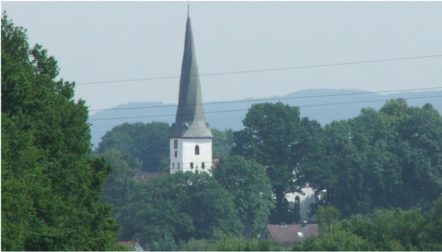
Dorfkirche Heiden