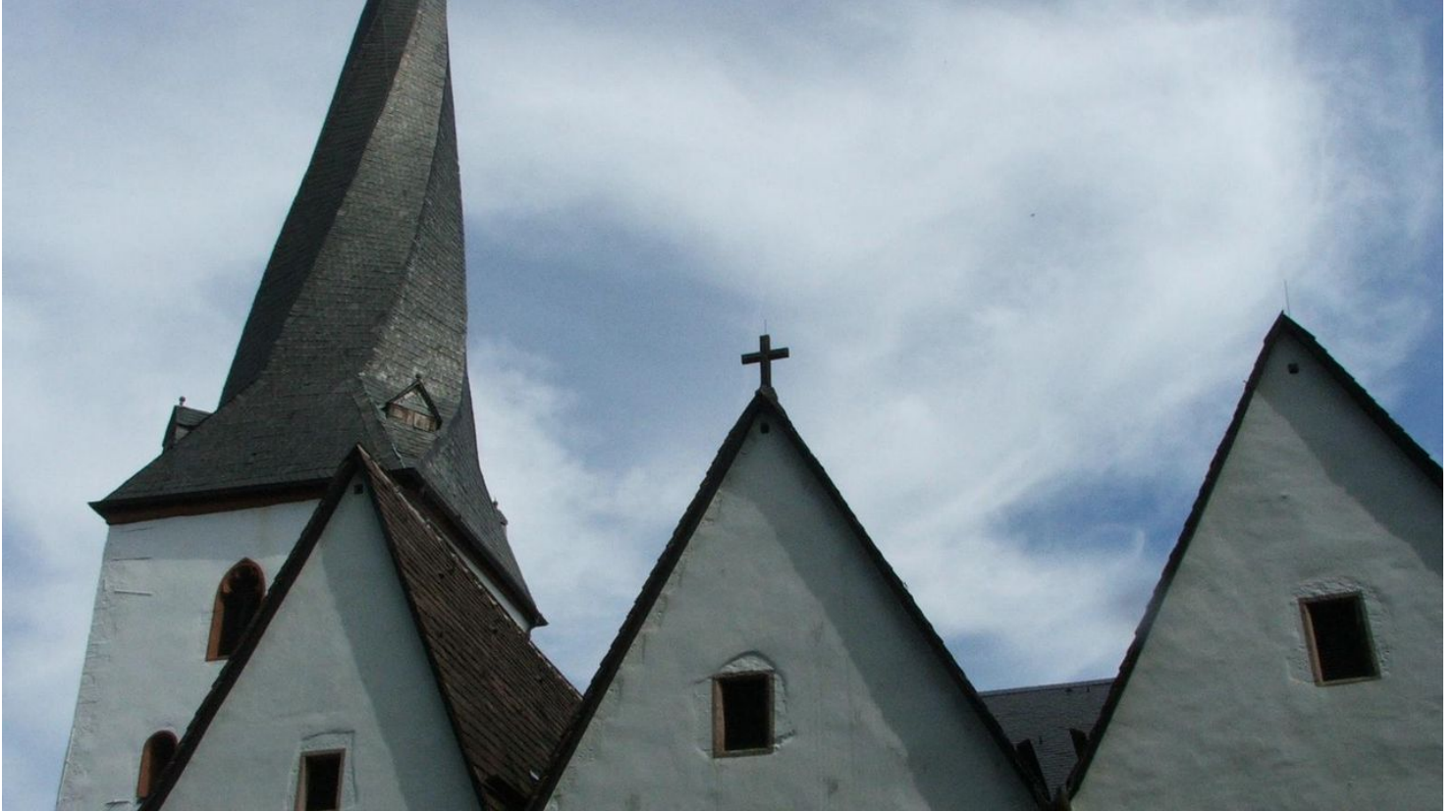
Dorfkirche Heiden