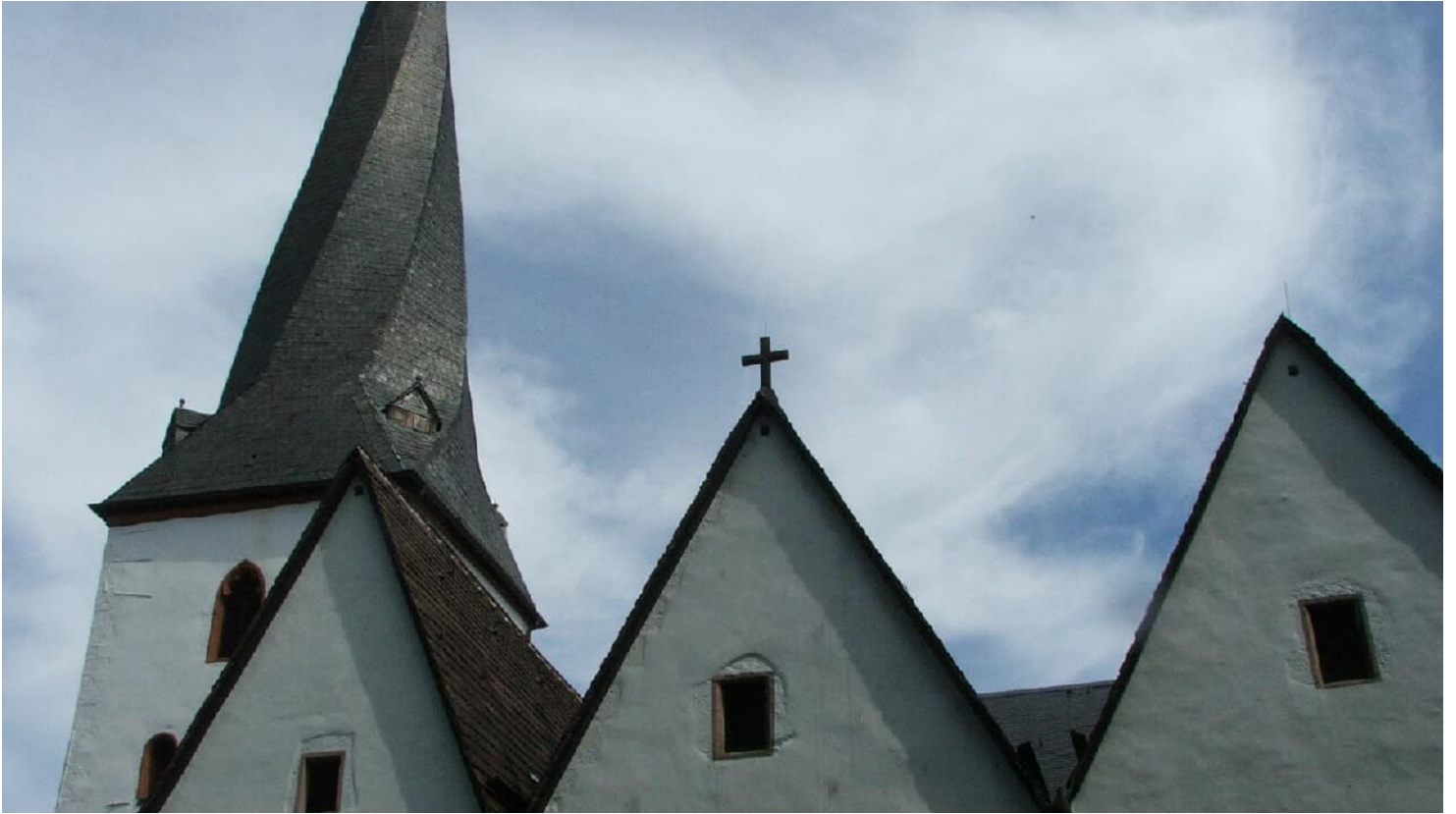
Dorfkirche Heiden