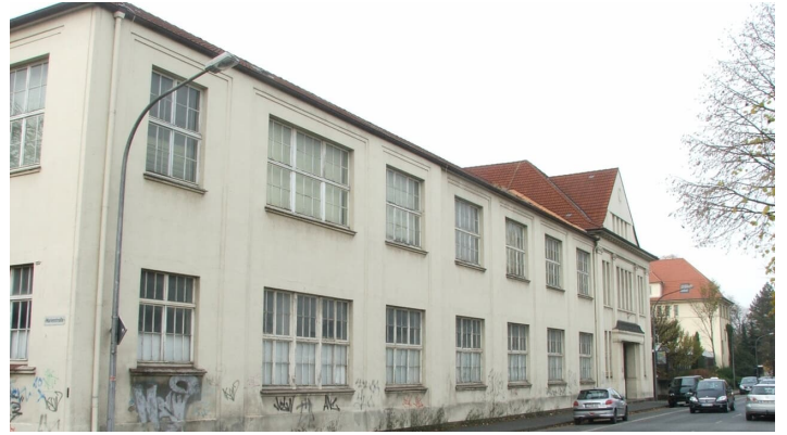
Friedrich-Ebert-Straße 4