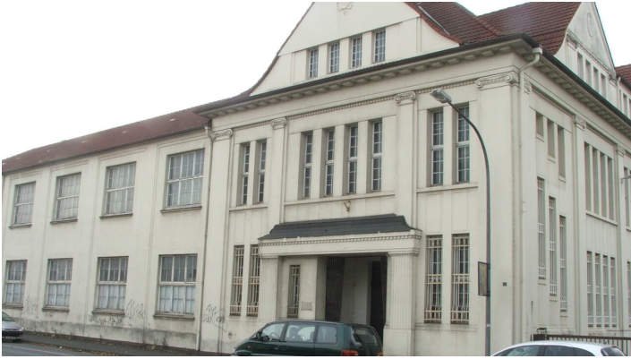
Friedrich-Ebert-Straße 4