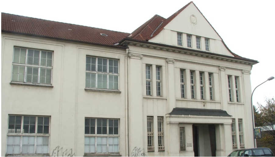
Friedrich-Ebert-Straße 4