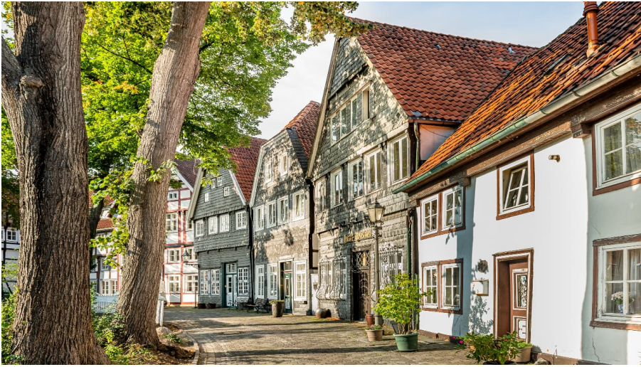
Kirchring Gütersloh