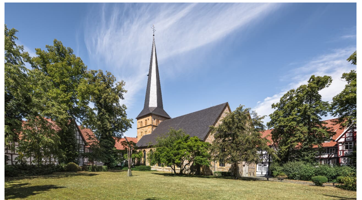
Alter Kirchplatz