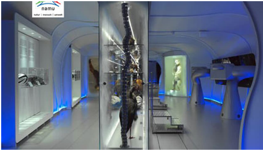
namu (Museum Natur, Mensch und Umwelt)