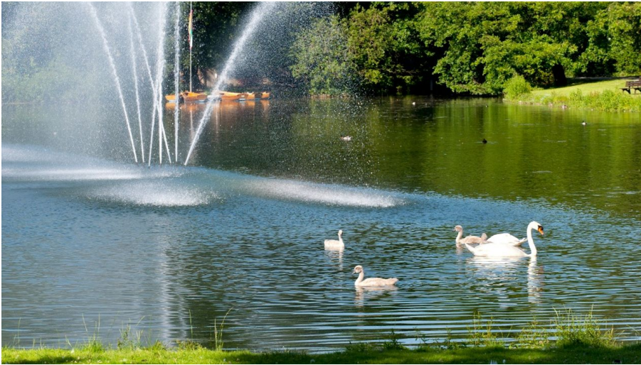
Fontäne Kurparksee Landschaftsgarten