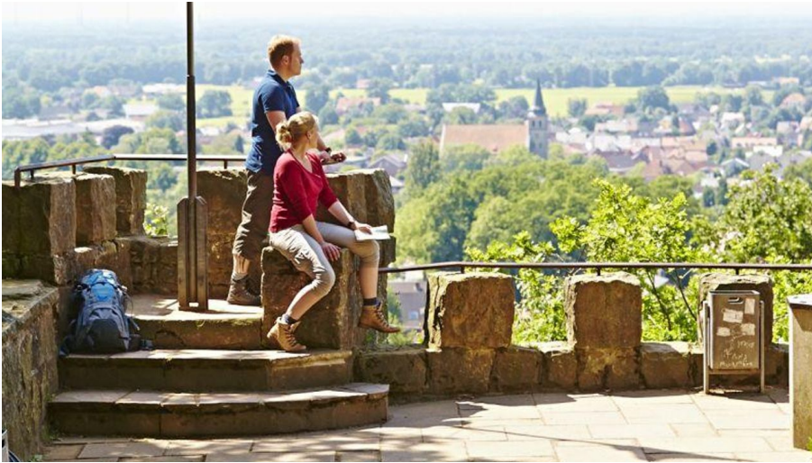
Schöne Aussicht in Hörstel