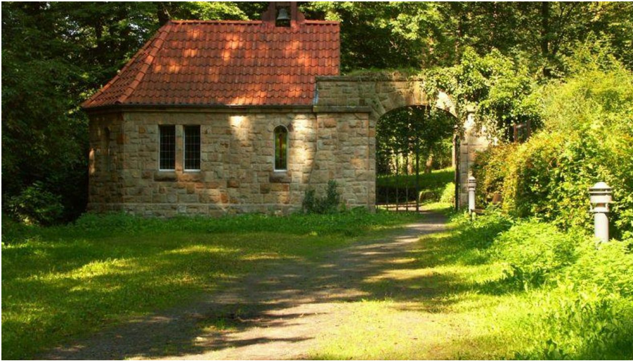
Friedhofskapelle Lengerich