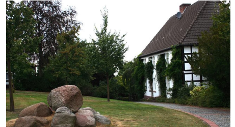
Kirchplatz Historischer Wegweiser