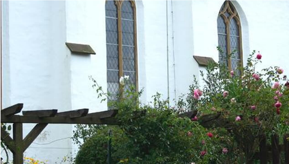
Stiftskirche Levern mit Rosen