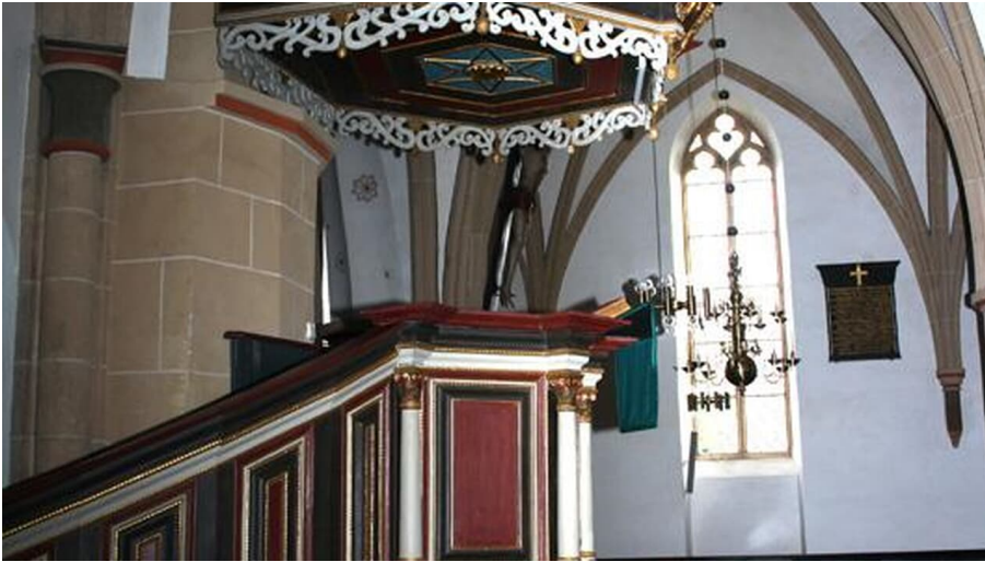
Altar in der Stiftskirche Levern