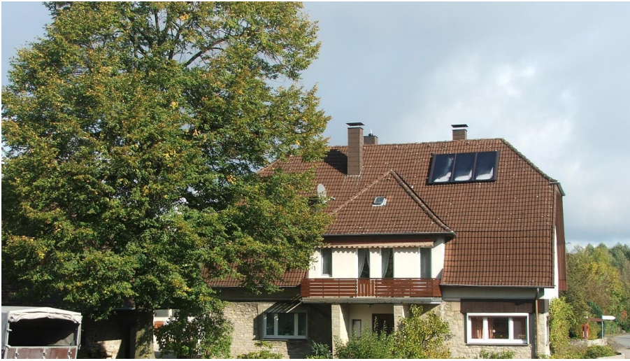
Hof Brink