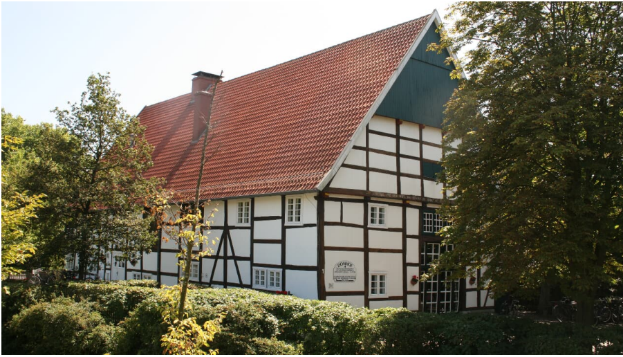
Domhof1.JPG - © Flora Westfalica GmbH Rheda-Wiedenbrück