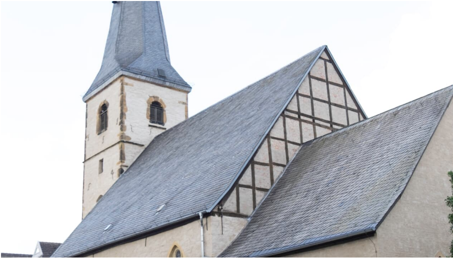
Stadtkirche in Rheda