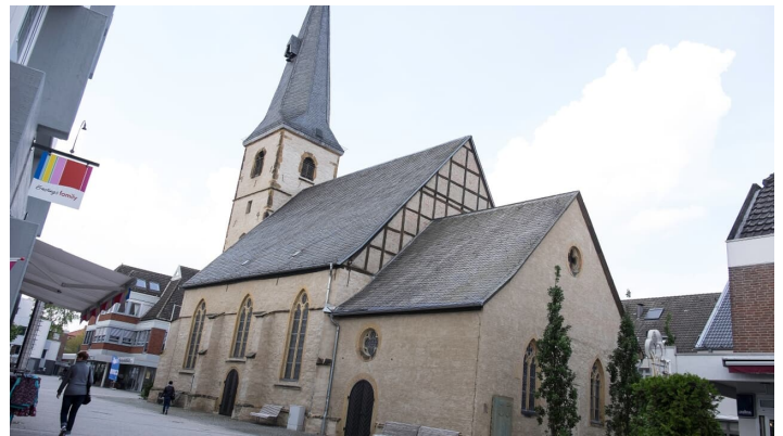
Stadtkirche in Rheda - © Uli Funke, Flora Westfalica -FGS- Fördergesellschaft Wirtschaft und Kultur mbH Rheda-Wiedenbrück