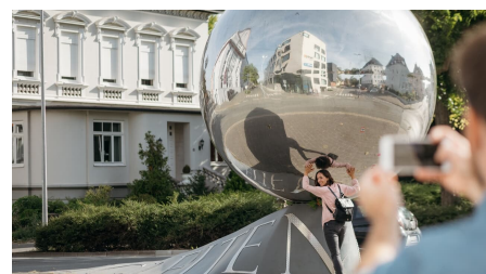
Marta Herford