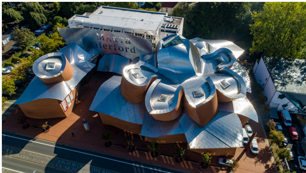
Marta Herford

Jeden 1. Mittwoch im Monat bis 21:00 Uhr geöffnet. Öffentliche Führungen: - Ausstellungen: smastags, sonntags und an Feiertagen um 12:00 und 15:00 Uhr. - Architektur: Jeden 1. Sonntag im Monat um 14:00 Uhr