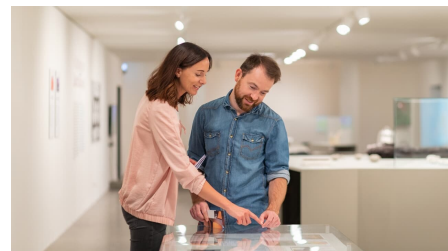
Marta Herford - © Pro Herford GmbH