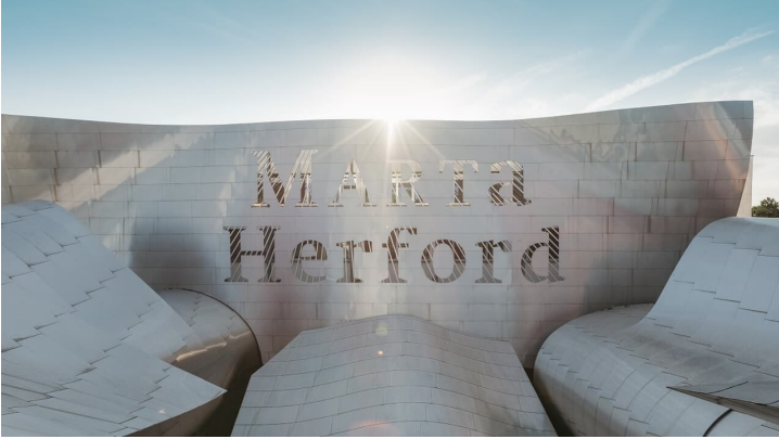
Marta Herford