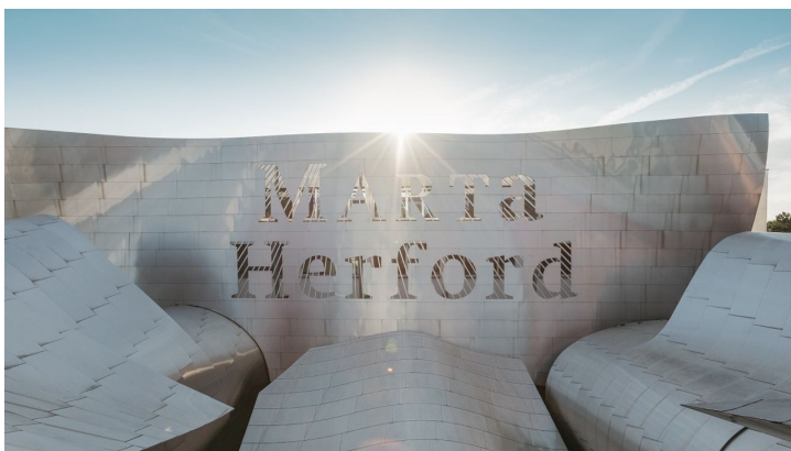
Teutoburger Wald Tourismus, M. Schoberer