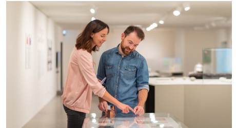
Pro Herford GmbH