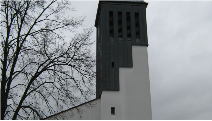
Katholische Kirche St. Raphael Preußisch Oldendorf