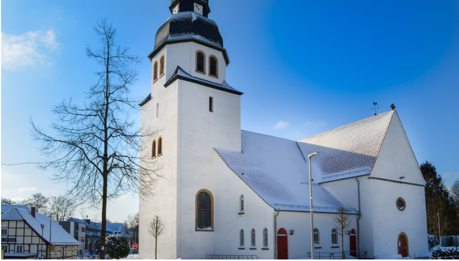
Verschneite St-Johannes-Baptist-Kirche im Ortsteil Stukenbrock in Schloß Holte-Stukenbrock