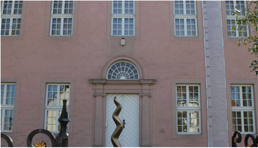
Städtische Galerie Eichenmüllerhaus