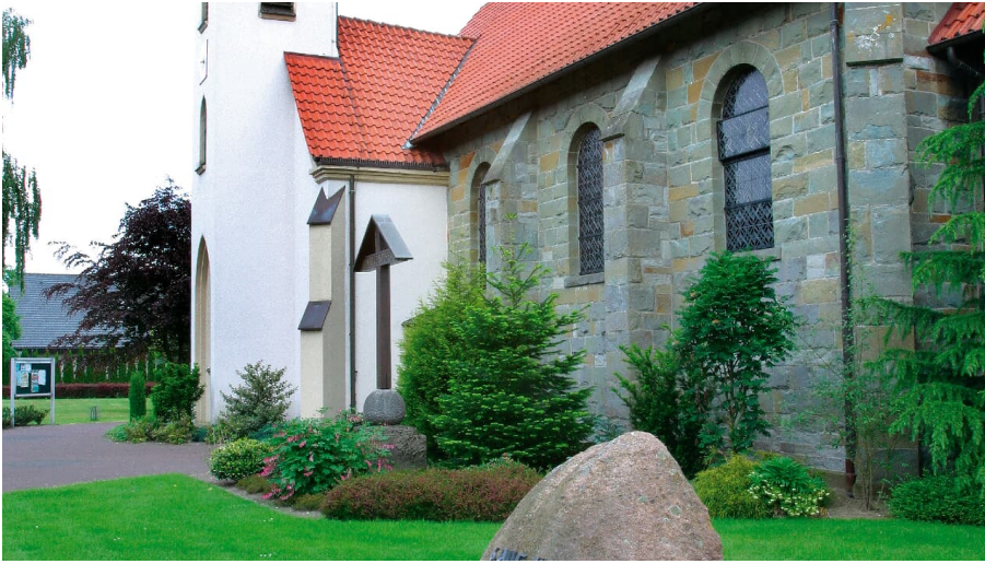
St. Meinolf Schöning - © Bernhard Hoppe-Biermeyer, Ricarda Bade