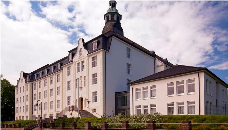
Ehemaliges Steyler Missionshaus St. Xaver, Bad Driburg