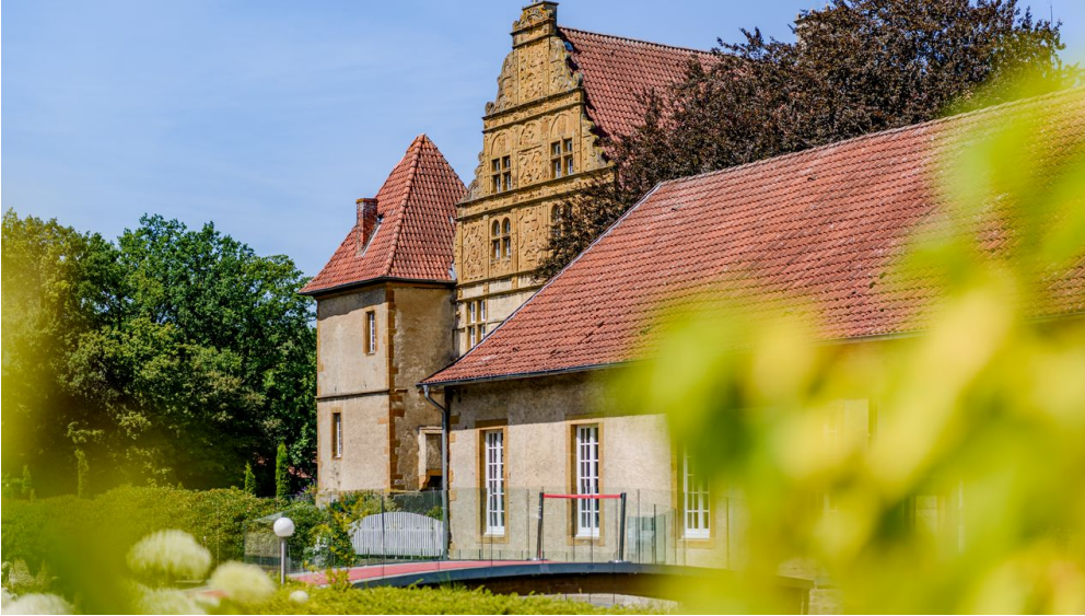
_BBB7000.jpeg - © Mario Wallenfang Fotografie