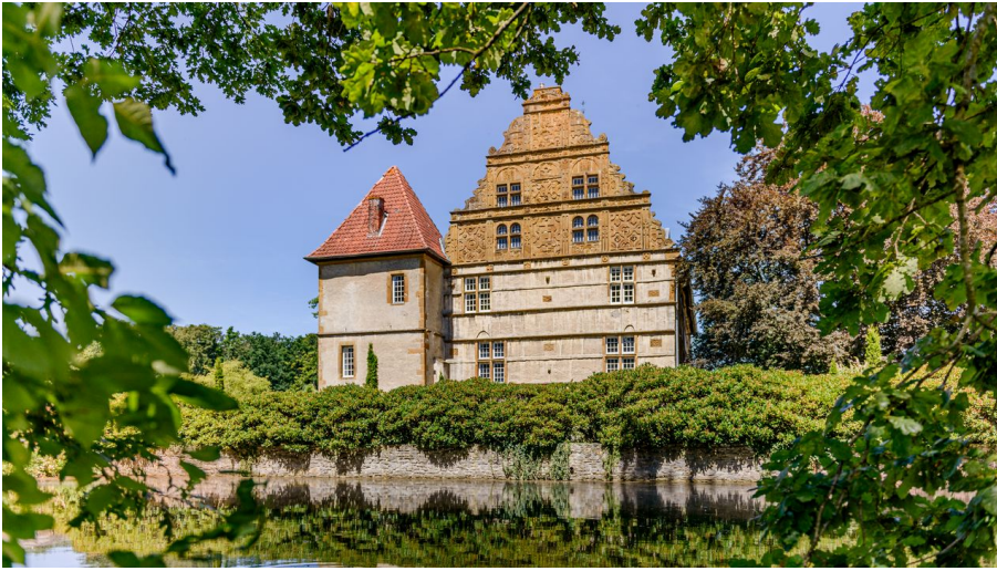
Wasserschloss Holtfeld