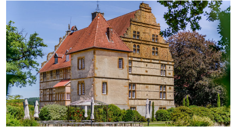
_BBB7026.jpeg - © Mario Wallenfang Fotografie