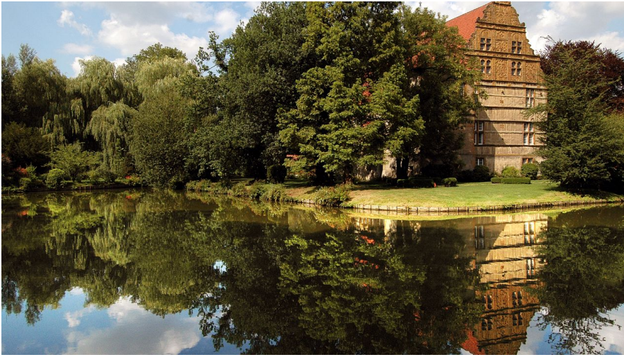
Wasserschloß Holtfeld