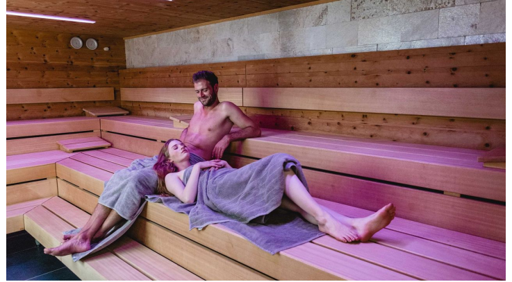
Entspannung in der Driburg Therme