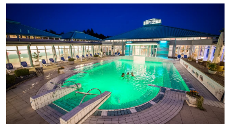
Driburg Therme - Außenbecken