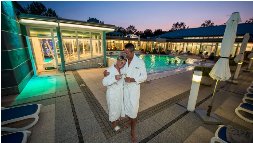
Driburg Therme - Paar am Außenbecken - © Daniel Winkler, Bad Driburger Touristik GmbH

Öffnungszeiten: Montag: 14:00 - 22:00 Uhr Dienstag: 10:00 - 22:00 Uhr Mittwoch: 10:00 - 22:00 Uhr Donnerstag: 10:00 - 22:00 Uhr Freitag: 10:00 - 22:00 Uhr Samstag: 10:00 - 20:00 Uhr Sonn-/Feiertag: 10:00 - 20:00 Uhr