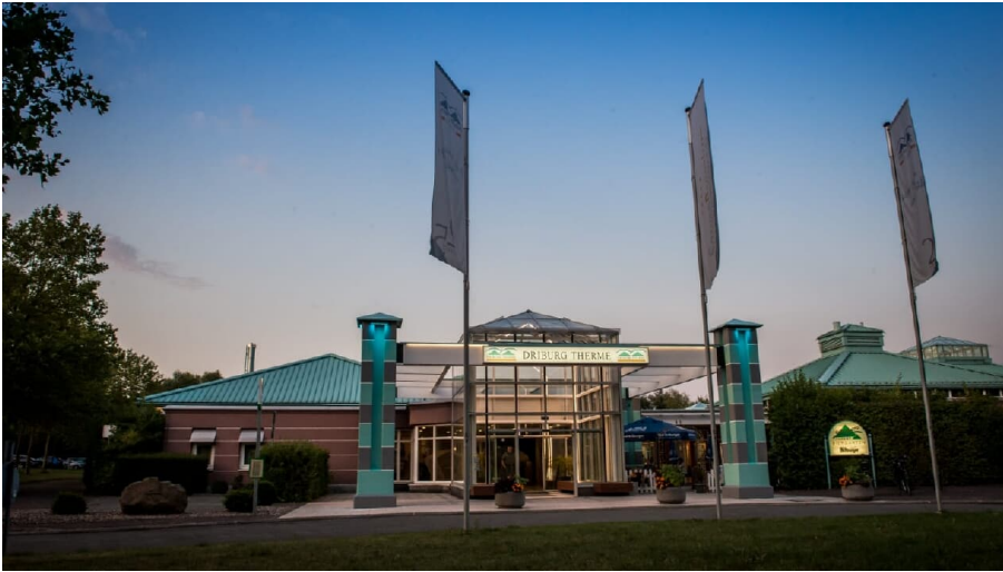
Driburg Therme - Frontansicht