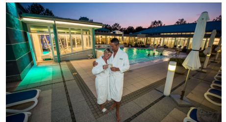
Driburg Therme - Paar am Außenbecken