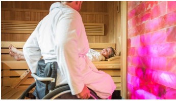
Zirbenholzsanarium in der Driburg Therme