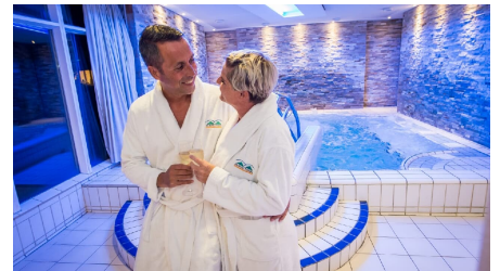
Driburg Therme - Paar am Whirlpool