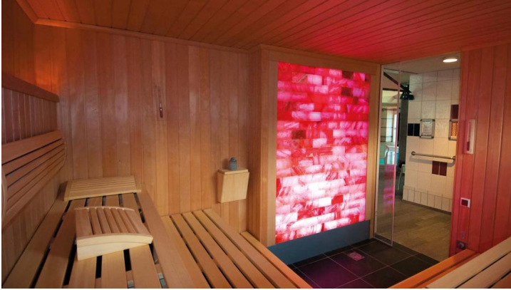
Salz Sauna in der Driburg Therme