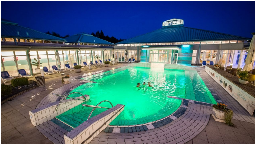
Driburg Therme - Außenbecken - © Bad Driburger Touristik GmbH

Öffnungszeiten: Montag: 14:00 - 22:00 Uhr Dienstag: 10:00 - 22:00 Uhr Mittwoch: 10:00 - 22:00 Uhr Donnerstag: 10:00 - 22:00 Uhr Freitag: 10:00 - 22:00 Uhr Samstag: 10:00 - 20:00 Uhr Sonn-/Feiertag: 10:00 - 20:00 Uhr