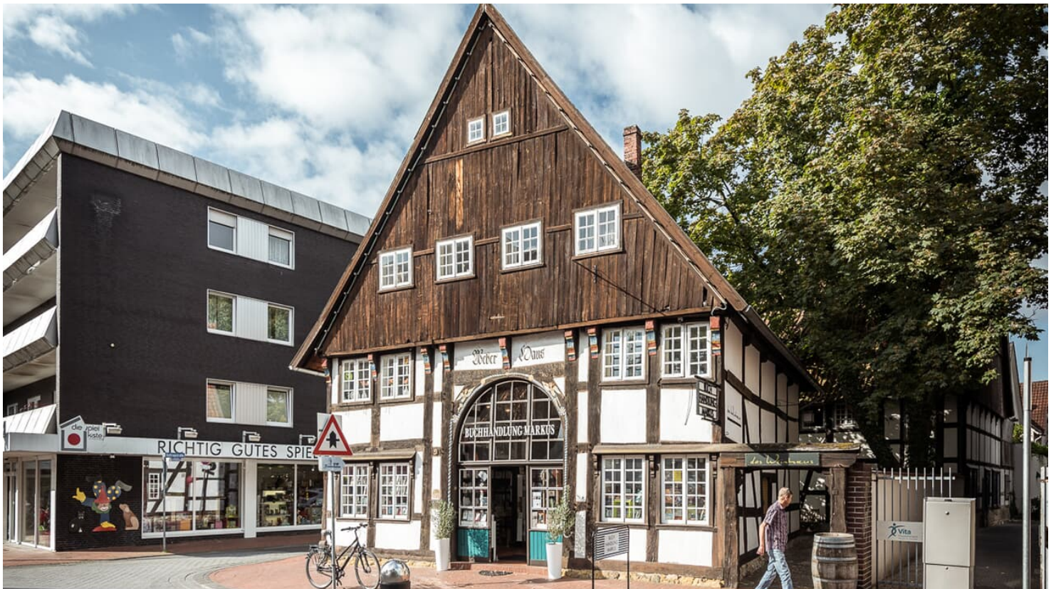
Elke Corsmeyer, Gütersloh, Detlef Gütkenke

Voor het laatst aangepast 18.11.2022, 14:39