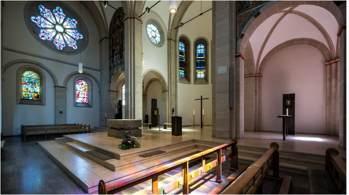
St.Pankratius Kirche