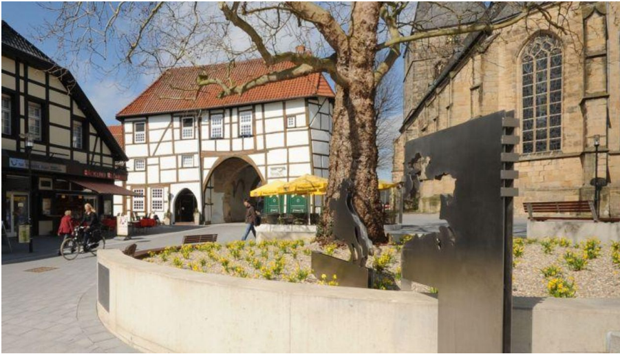
Ev. Stadtkirche Lengerich mit Römer / Friedensreiter