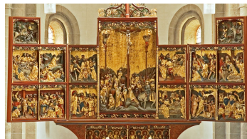
Schnitzaltar von 1525 des Meisters Hinrik Stavoer