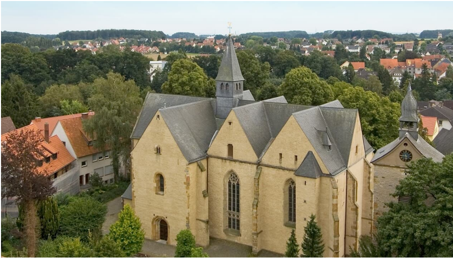
Stiftskirche in der Widukindstadt Enger