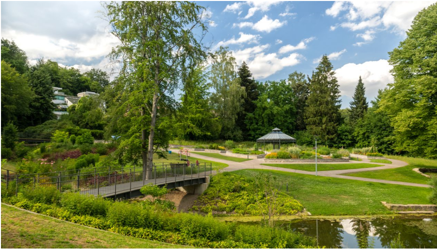
Bielefeld-Botanischer Garten-Teutoburger-Wald-Tourismus-D-Ketz-095.jpg