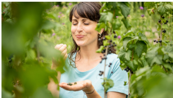
Bielefeld-Botanischer Garten-Teutoburger-Wald-Tourismus-D-Ketz-104.jpg