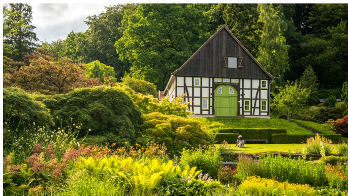
Bielefeld-Botanischer Garten-Teutoburger-Wald-Tourismus-D-Ketz-097-CC-BY-SA.jpg