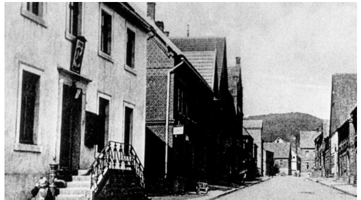
Das zweite Rathaus in der Schulstraße 1834-1947