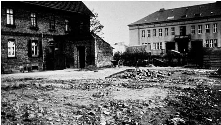
Das dritte Rathaus, ab 1947

entstammen diese den Archiven der Stadt Bad Driburg, Meiners, Herzog oder Gehle.