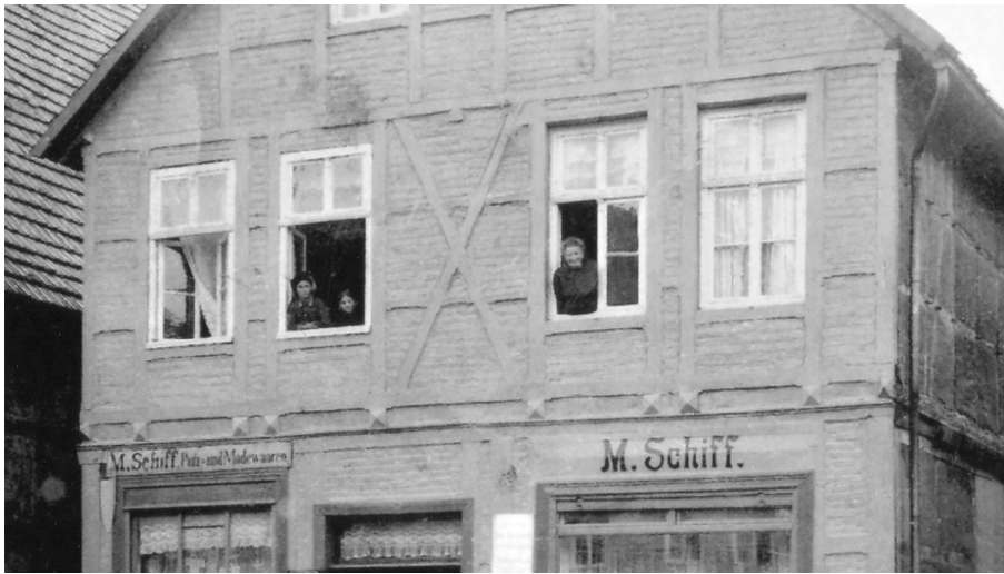
Haus Schiff