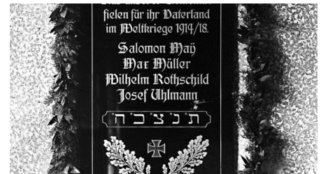
Gedenktafel 1. Weltkrieg