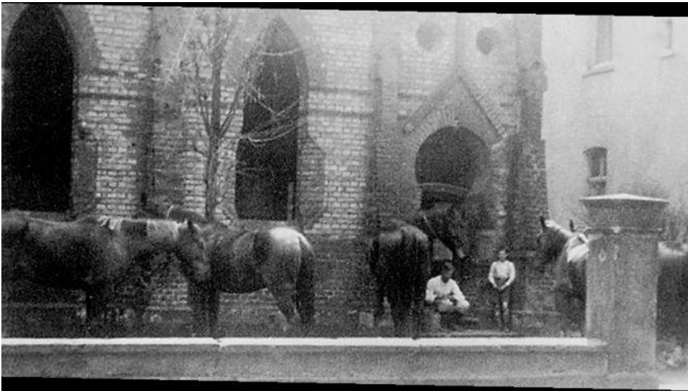
Zerstörtes Synagogengebäude, 1941

entstammen diese den Archiven der Stadt Bad Driburg, Meiners, Herzog oder Gehle.