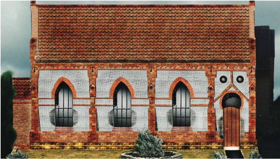
Synagoge, vor 1938