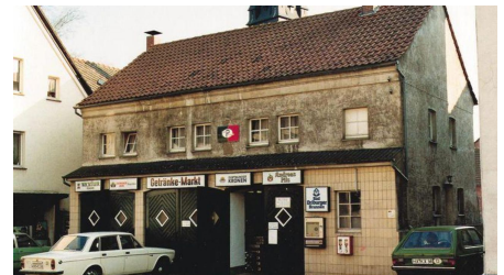
Synagogengebäude als Getränkemarkt, 1980