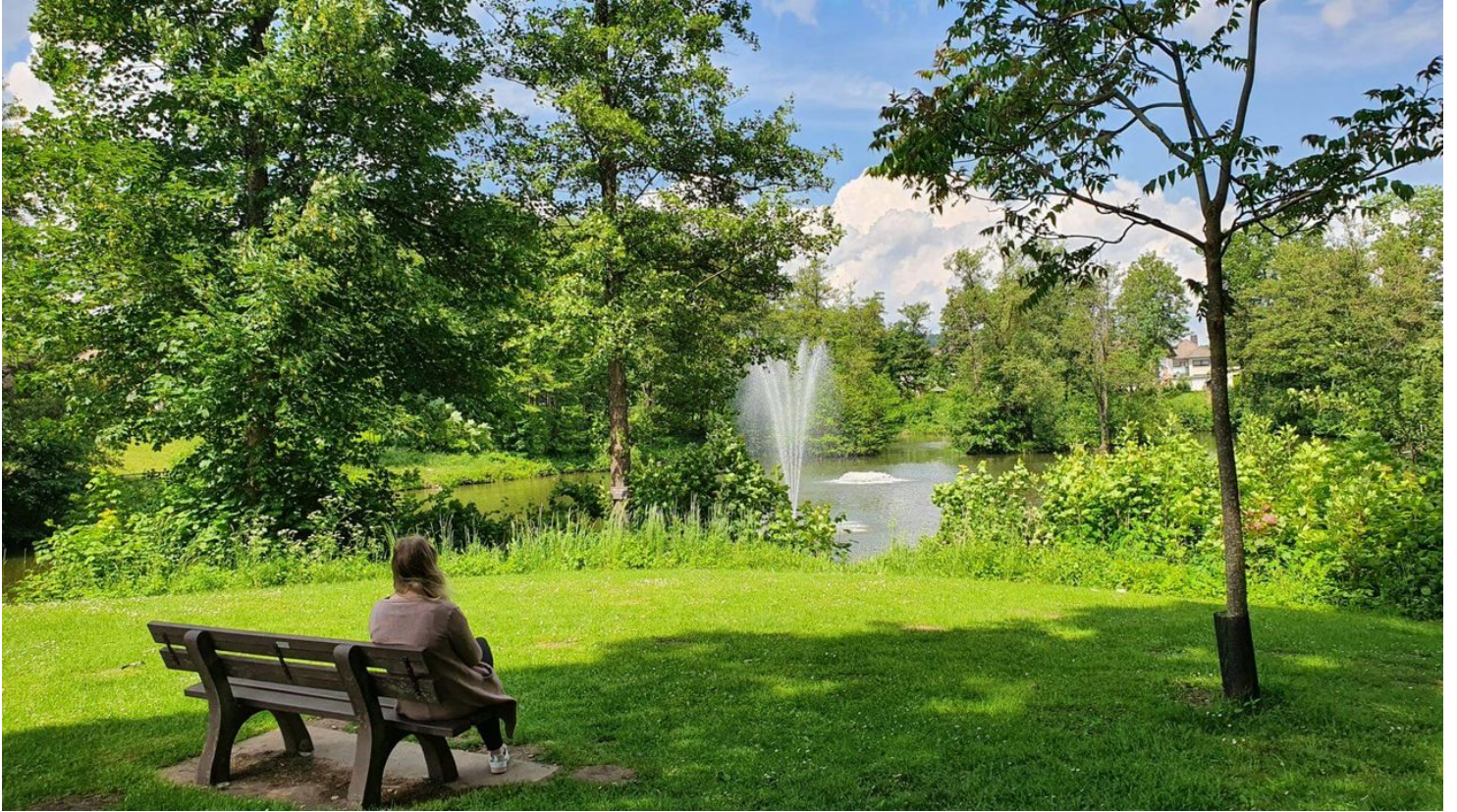
Stadtpark Bad Driburg