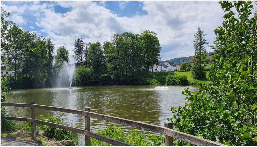
Stadtpark Bad Driburg.jpg