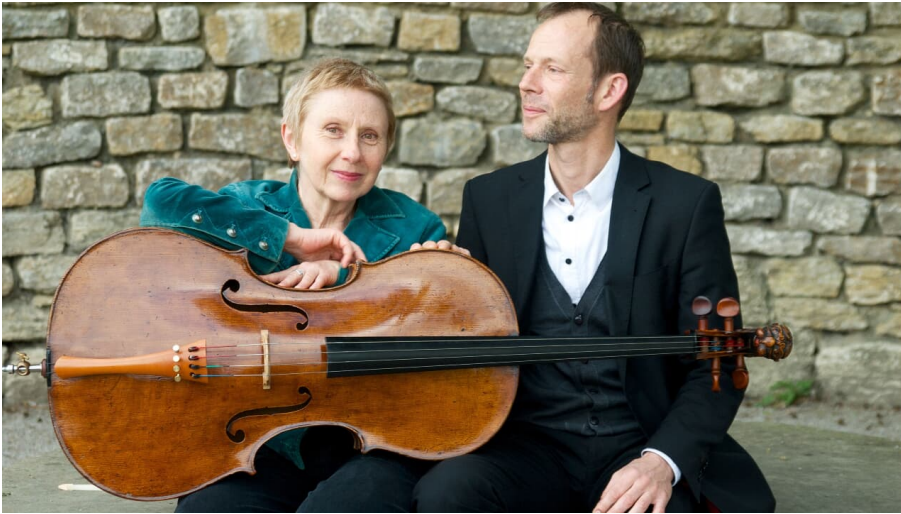
WEGE ERLEBEN

Stadthalle/Tagungszentrum/Begegnungsstätte