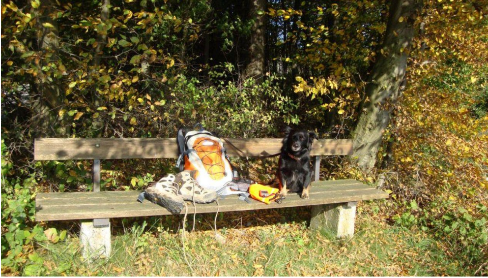
Max und Moritz - © Max und Moritz Hundewandern