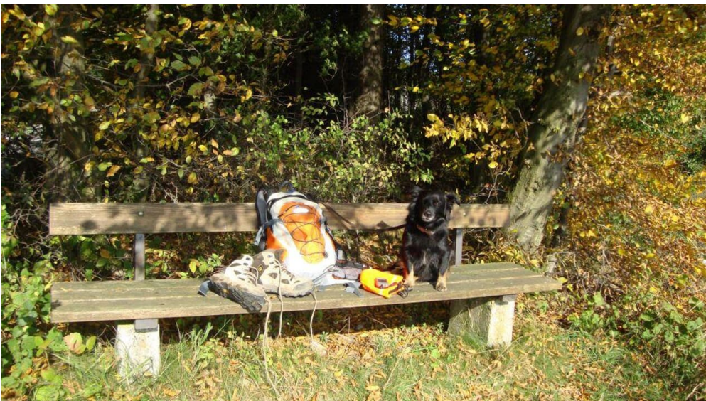
Max und Moritz - © Max und Moritz Hundewandern