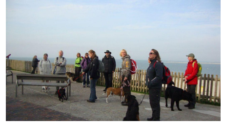
Max und Moritz