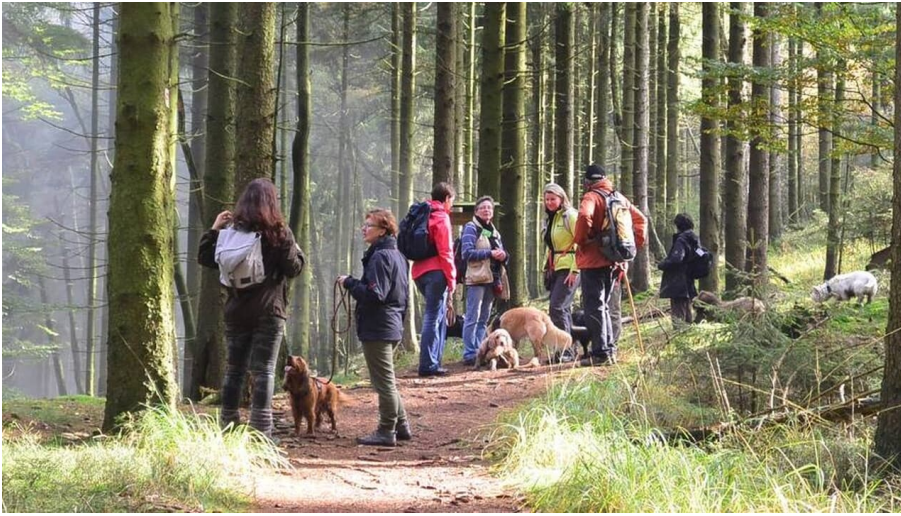
Max und Moritz: Wandern in der Gruppe - © Max und Moritz Hundewandern