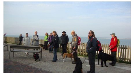
Max und Moritz - © Max und Moritz Hundewandern