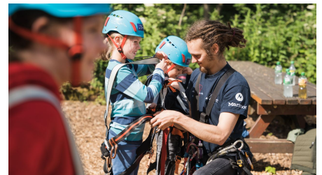
Kletterpark Bielefeld4.jpg