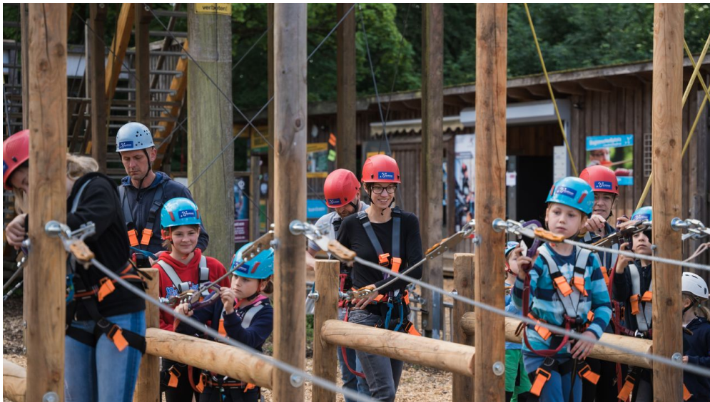
Kletterpark Bielefeld1.jpg

In der Regel dauert die Saison des Kletterparks Bielefeld vom ersten Freitag im April bis zum ersten Sonntag im November. - an Freitagen ab 13 Uhr - an Samstagen & Sonntagen ab 10 Uhr - an Feier- und Brückentagen - in den NRW-Ferien immer Dienstag bis Sonntag - April bis September: jeweils ab 10 Uhr (letzter Starttermin 17 Uhr, ab Mitte September drei Stunden vor Einbruch der Dunkelheit) - Oktober & November: jeweils ab 10 Uhr (letzter Starttermin drei Stunden vor Einbruch der Dunkelheit) Gruppenbuchungen: Ganzjährig und außerhalb der regulären Öffnungszeiten sind die Kletterparks in Bielefeld und Detmold auf Anfrage für Gruppen buchbar! https://www.interakteam.de/event/klettertour-fuer-gruppen/