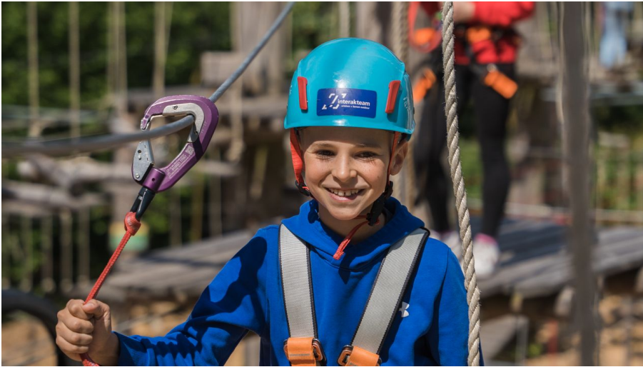
Kletterpark Bielefeld2.jpg