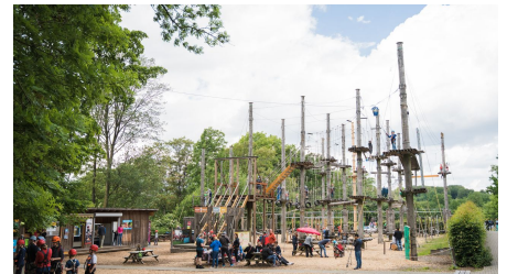
Kletterpark Bielefeld3.jpg