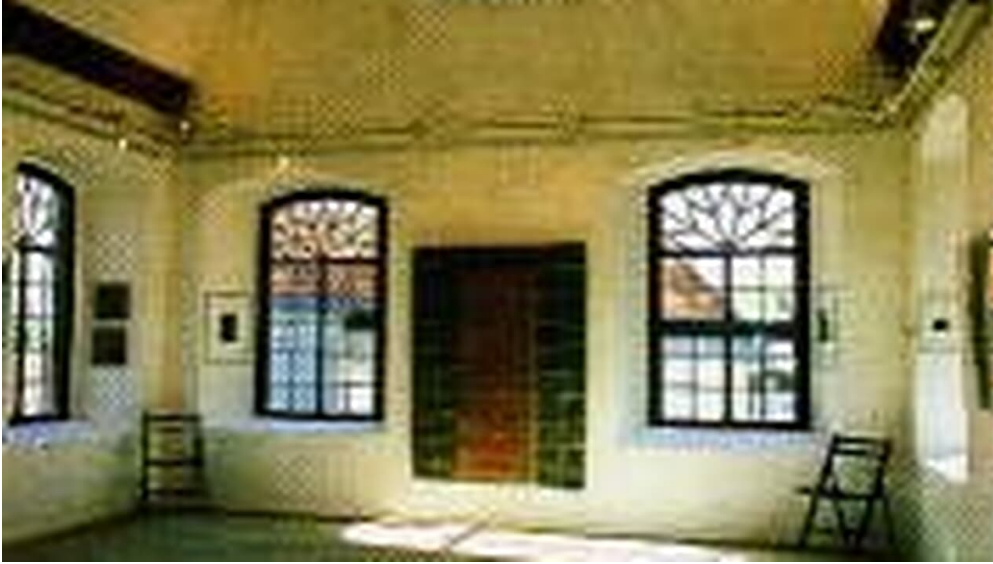
S - © Stadt Oerlinghausen, Stadt Oerlinghausen

Quelle: destination.one ID: p_100039283 Zuletzt geändert am 01.02.2022, 14:32