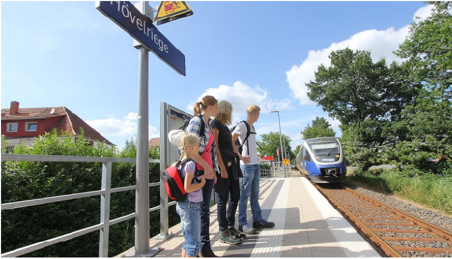
Am Haltepunkt Hövelriege