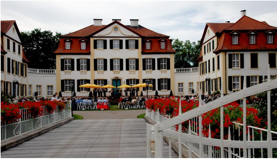
Schloss Hüffe im Mühlenkreis