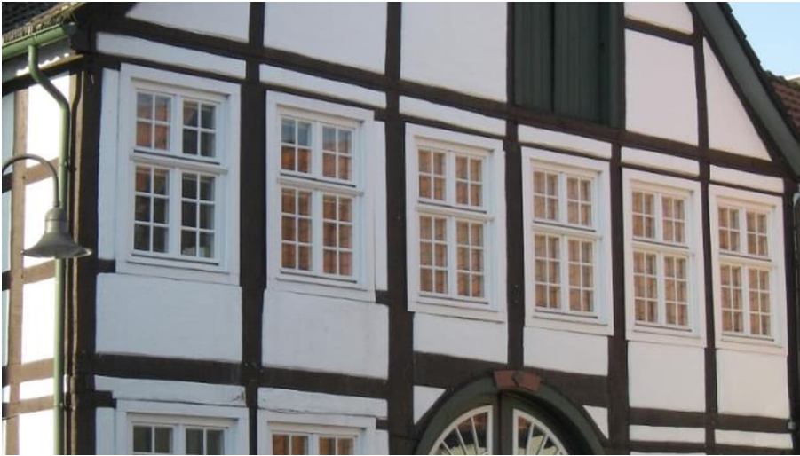
Ehemaliges Verlagshaus Vahle