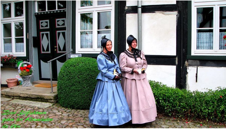
Stiftsdamen begleiten die historische Erlebnisführung