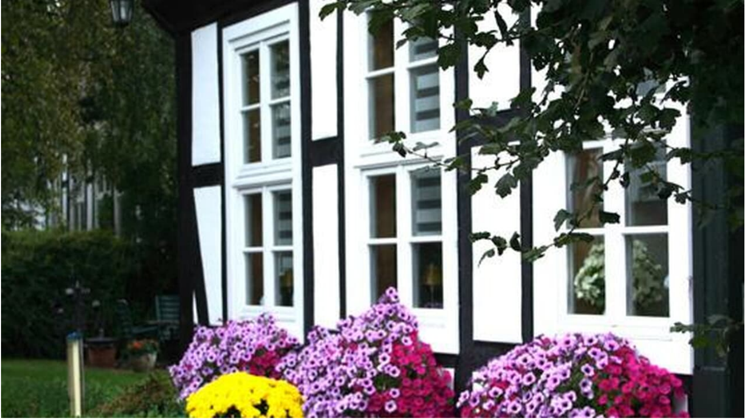
Stiftskurie von Korff, 1725

ID: p_100039305 Zuletzt geändert am 15.03.2023, 09:38