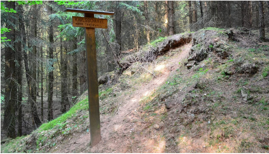
Karlsschanze historischer Innenwall