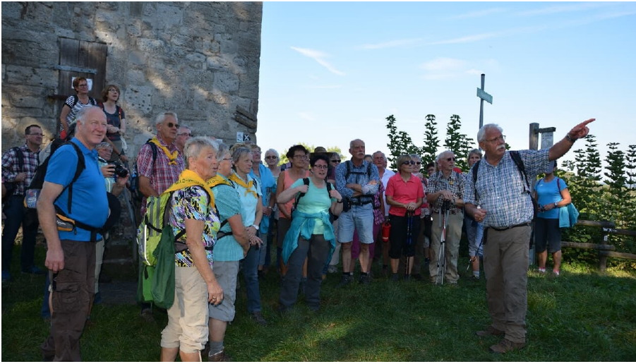
Wandergruppe am Aussichtsturm