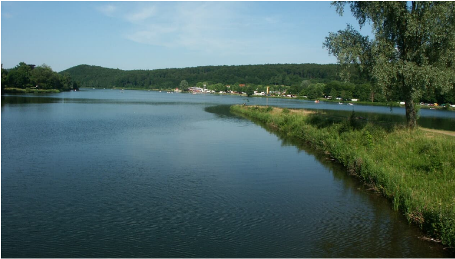
Blick auf den SchiederSee