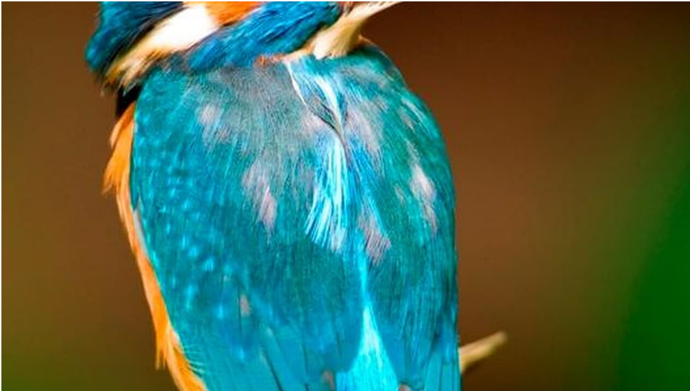
Der Eisvogel - Juwel der Lüfte