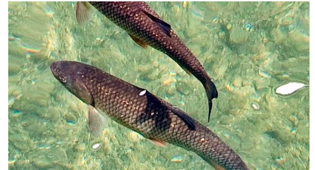
Der Döbel