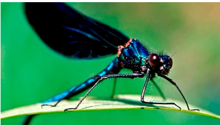
Im Reich der Prachtlibellen