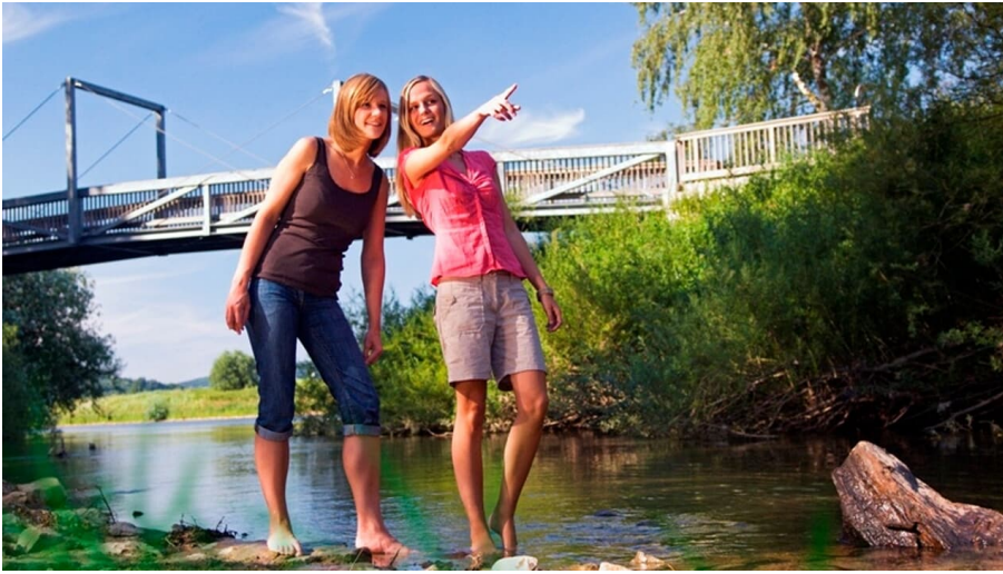
Erfrischung im Reich der Prachtlibellen