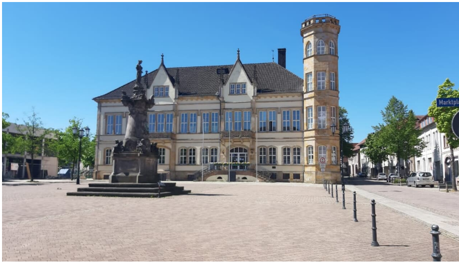
Rathaus Horn