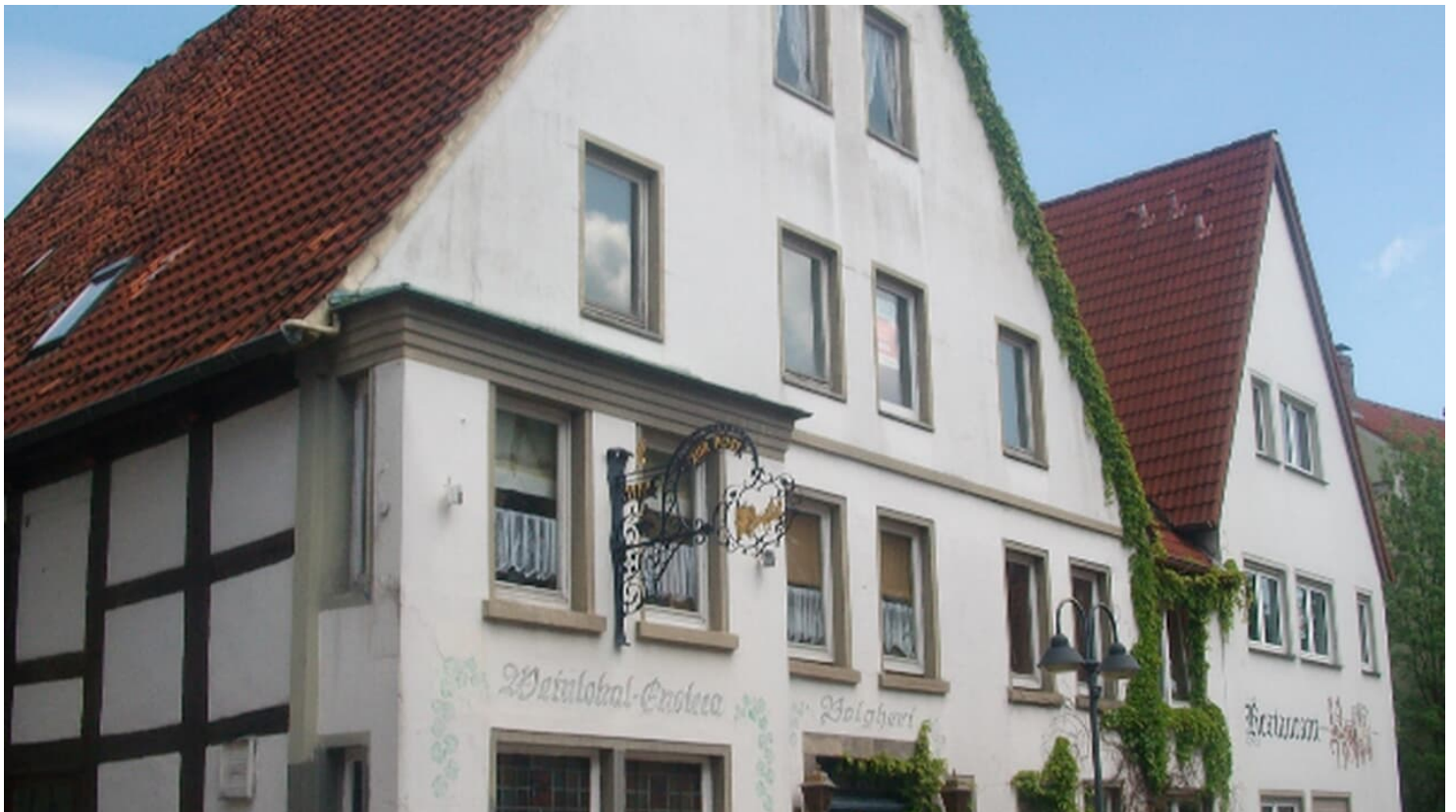
Haus Nummer 91.jpg