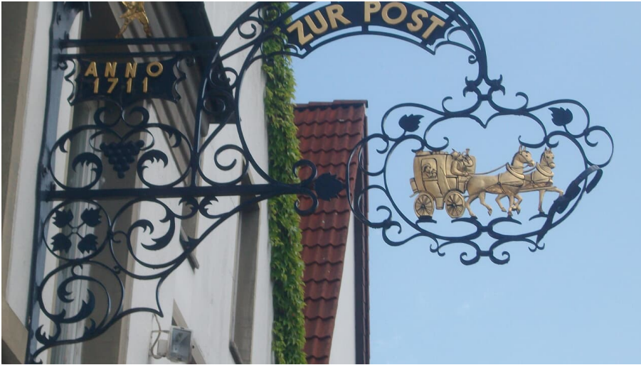
Schild zur Post.jpg