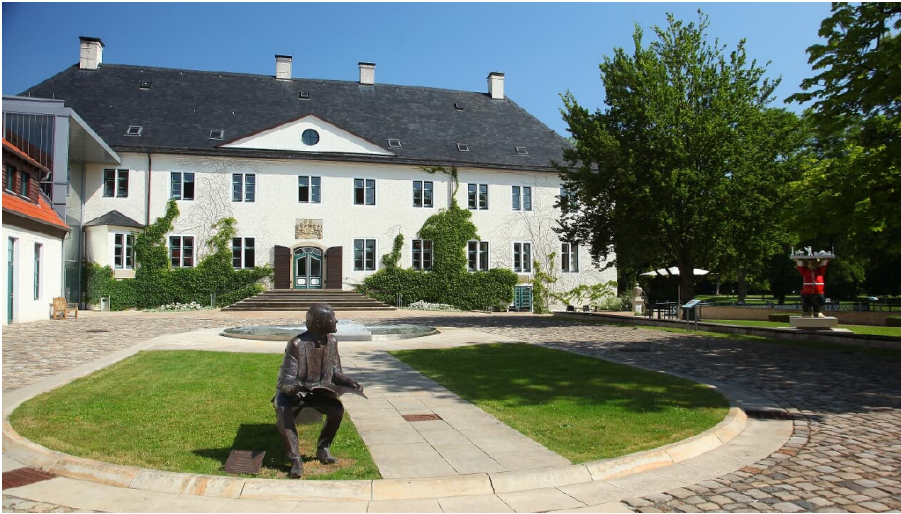
Schloss Benkhausen